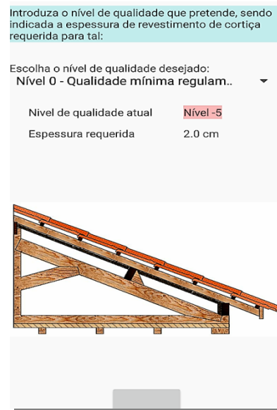
Figura 8 – Opção nº 6 da aplicação móvel.