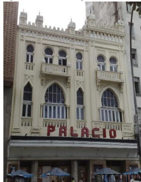
Figura 1 – Fachada antiga do Cine Palácio

O prédio estava fechado desde 2008, recebeu investimento privado do Fundo Oportunity e passou por uma reforma em 2004, quando foi restaurada toda a sua fachada, após quase 30 anos coberta por placas de alumínio. Tombado pelo município do Rio de Janeiro, o futuro empreendimento comercial ocupará quase todo o quarteirão, em um terreno de 100 mil m 2 e haverá uma praça de alimentação que conectará os espaços.