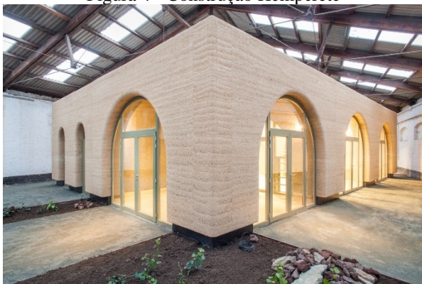
Figura 4 - Construção Hempcrete

A empresa francesa Art du Chanvre edificou aproximadamente 45 casas com o hemcrete , sua utilização como concreto é feita com utilização de formas, já que não é considerado concreto estrutural, e revestida com cal permeável ao vapor a base de gesso. Na Carolina do Norte, foi construída uma casa de 315m 2 apenas utilizando o hemcrete . Estima-se que são absorvidos 50kg líquidos de CO 2 por m 2 de concreto a base de cânhamo, além de receber uma qualificação de resistência R30 e ser altamente resistente ao fogo, regulando a temperatura da residência tanto em dias frios, como em dias mais quentes. Para edificar uma casa utilizando o hemcrete , é necessário um tipo de equipamento específico para assentamento do material no interior das formas, e seu tempo de cura é de aproximadamente 6 semanas. Porém, ao optar por utilizar blocos de concreto a base de cânhamo, o serviço se torna mais simples, por se tratar de um material muito leve, utilizando 2 pedreiros é possível construir uma casa em aproximadamente 2 semanas. [20]