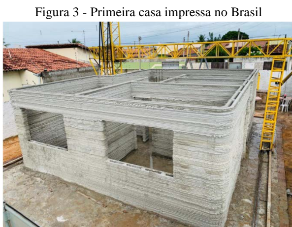
Figura 3 - Primeira casa impressa no Brasil