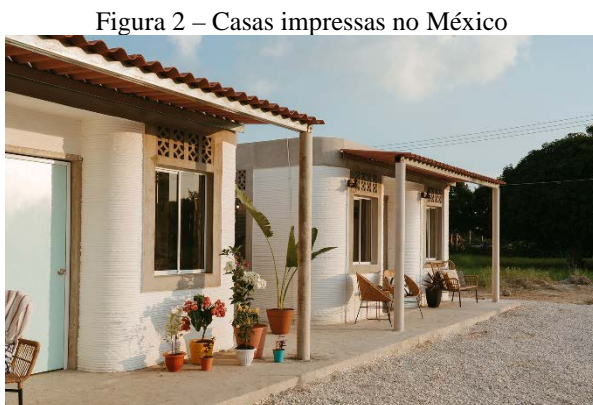
Figura 2 – Casas impressas no México

No Brasil a pioneira no ramo da construção de casas utilizando impressoras 3D foi a start-up 3DHomeConstruction, que finalizou a primeira casa 3D em solo nacional no estado do Rio Grande do Norte, em 2020. A empresa, iniciou seu projeto em 2017 como um projeto de Graduação ainda na Universidade Potiguar. Os até então alunos, construíram sua própria impressora, se baseando em dispositivos já existentes no mercado. Os 3 Engenheiros fizeram uma casa de 62m 2 e o preço médio do m 2 saiu por R$50,00, segundo os desenvolvedores podendo cair ainda mais o valor com a evolução da tecnologia.[16]