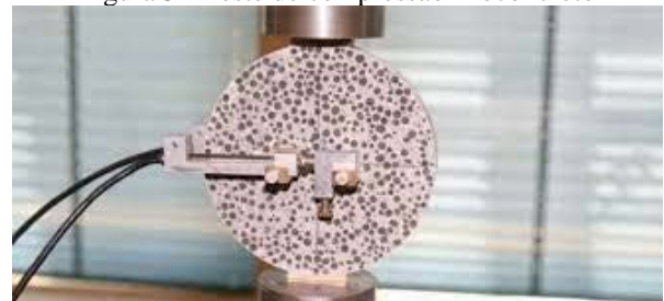
Figura 5 - Teste de compressão Bioconcreto

O Bioconcreto chega para sanar gastos exorbitantes de manutenção de edificações, por não demandar uma intervenção agressiva, o bioconcreto atua como parte integrante da construção como se fosse um organismo vivo que cura seus próprios ferimentos. Usando o ser-humano como exemplo, que possui agentes que identificam a doença e ativam seus anticorpos do sistema imunológico para se defender contra bactérias, vírus ou corpos estranhos. O bioconcreto atua da mesma maneira, quando uma patologia surge na edificação, gerando algum tipo dano a estrutura ou fachada a bactéria é ativada através da umidade que infiltram nos vãos da construção, a bactéria quando ativa consome o lactato de cálcio presente na mistura e produz o carbonato de cálcio que preenche os espaços de fissuras, impedindo que entre mais umidade e selando a edificação, da mesma maneira que os anticorpos em nosso corpo. No processo de cura do concreto a bactéria vai se multiplicando, impregnando a mistura, ao finalizar a pavimentação do concreto, a bactéria volta ao seu estado de esporo. [24]